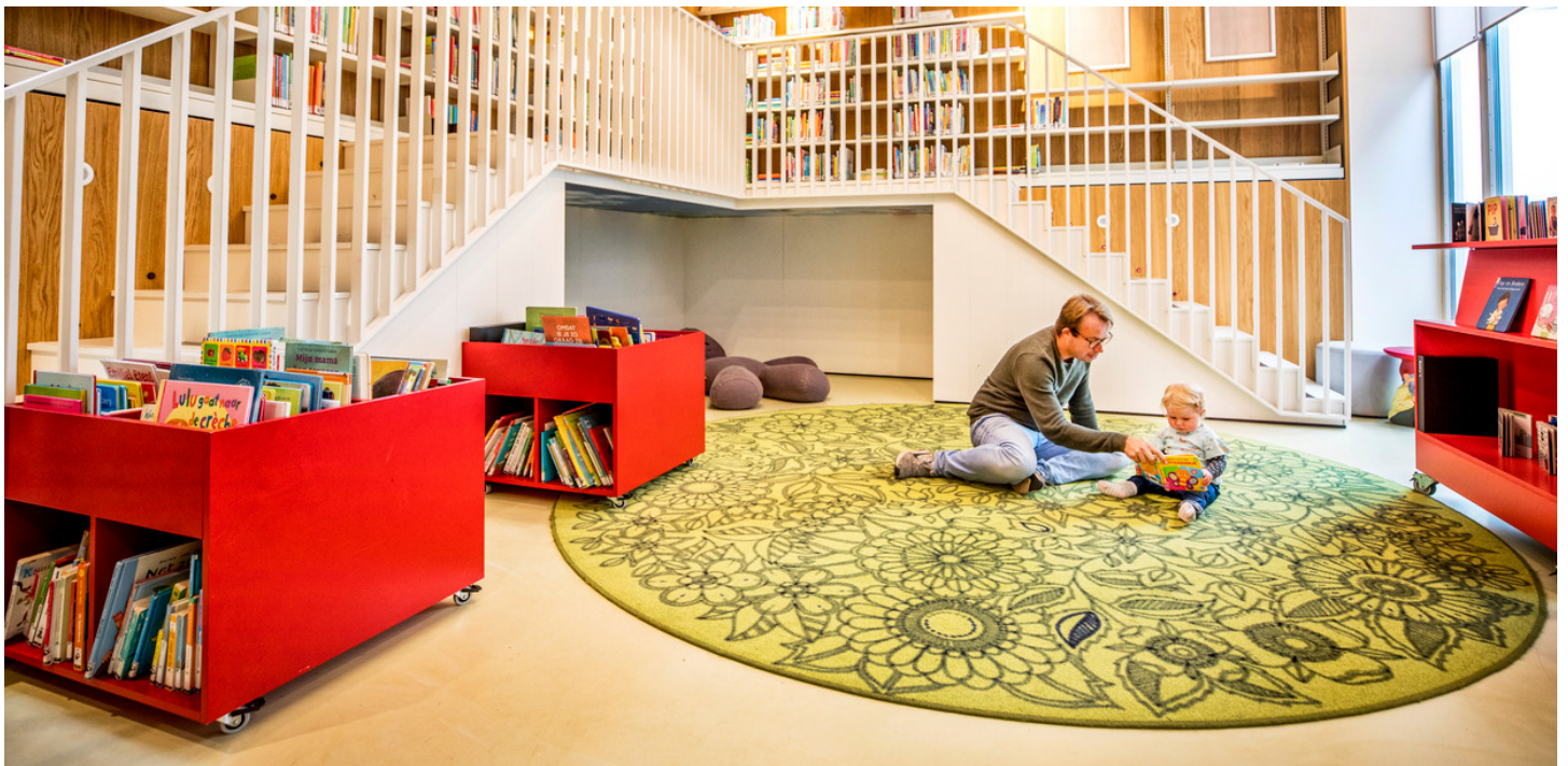
De afdeling kinderboeken van Bibliotheek School 7.

De bibliotheek van Den Helder is uitgeroepen tot de beste van de wereld. Een oppepper voor de marinestad die al tien jaar werkt aan de revitalisering van het centrum.