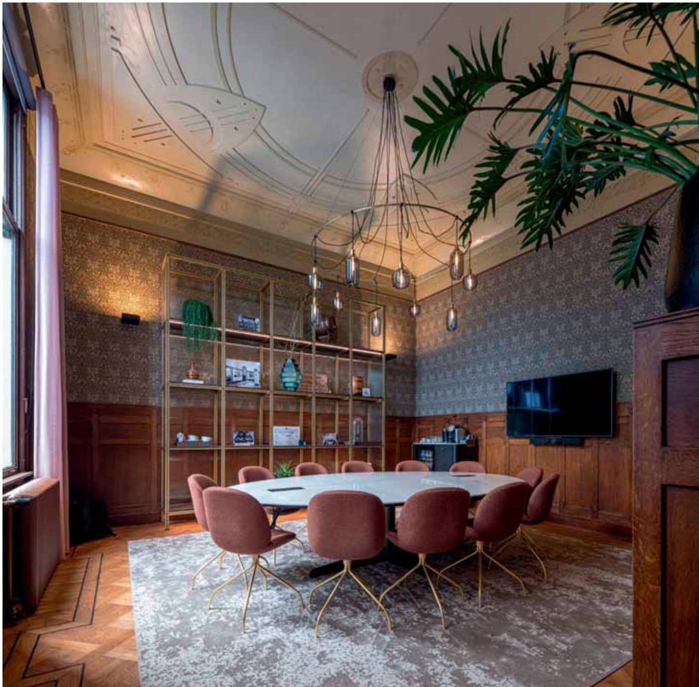
FOTO LINKS The Boardroom, een vergaderruimte in een van de voormalige directiekamers van het Heineken Gebouw Rotterdam.

Onlangs is het voormalige Rotterdamse kantoor van Heineken heropend onder de naam Heineken Gebouw Rotterdam. MARS Interieurarchitecten restaureerde de voormalige directiekamers tot een bijzondere vergaderlocatie, met veel respect voor het rijksmonument, en een vleugje nostalgie.