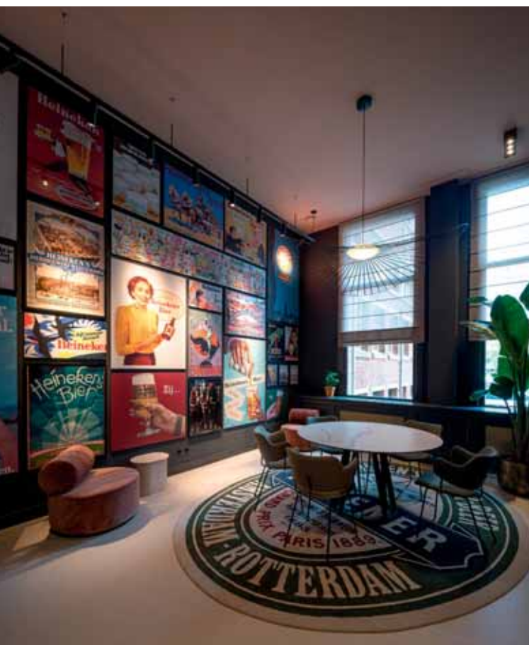
FOTO RECHTSONDER Vitrinekast in The Family Room, met uitgelichte foto's en objecten uit de Heineken-collectie.