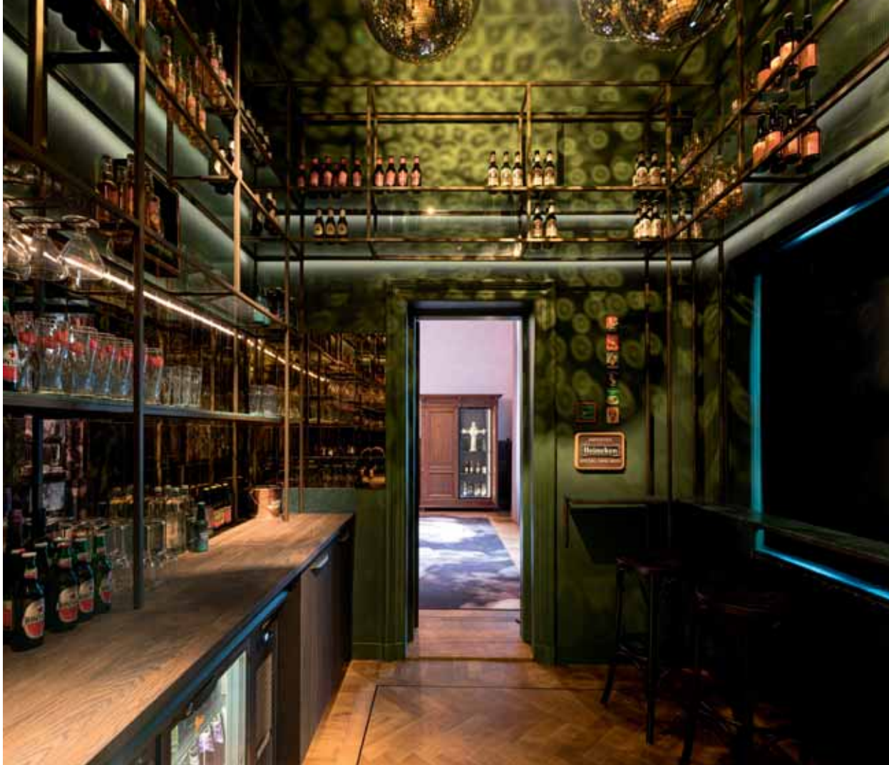
FOTO BOVEN De bar bij The Family Room.